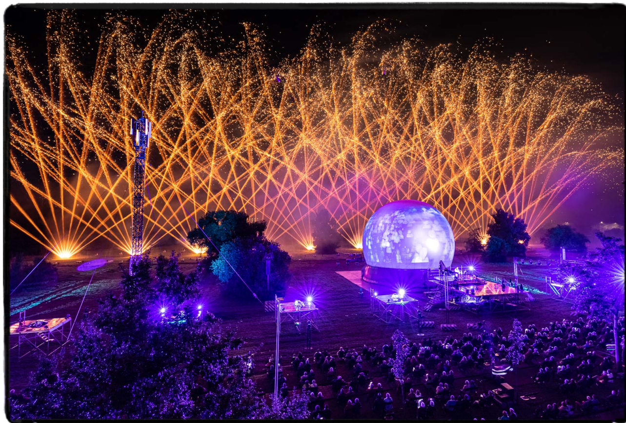
Échappée Belle, Groupe F, Openingsvoorstelling