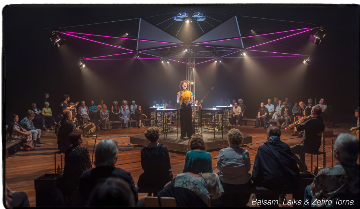
Balsam, Laika & Zefiro Torna