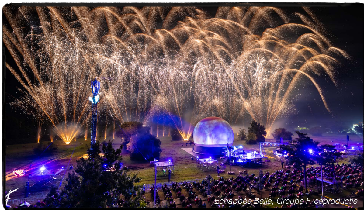
Échappée Belle, Groupe F, coproductie

Met een omvangrijk aanbod kende Cultura Nova 2021 toch volop publieke belangstelling. Er was duidelijk honger naar cultuur. De mensen waren blij dat ze weer naar het festival konden komen. De bezetting was goed en er waren veel voorstellingen 'uitverkocht'. De makers waren zeer enthousiast; eindelijk weer spelen voor echt publiek! Het leek wel of iedere maker een schepje erbovenop deed. Er ontstond ondanks de beperkingen toch een goede festivalsfeer en het gonsde als vanouds in de stad. We zijn er trots op ondanks alles toch ruim 30.000 bezoeken hebben mogen genereren.